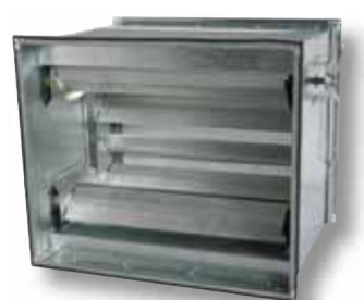
Směšovací komora s otočnými lamelami