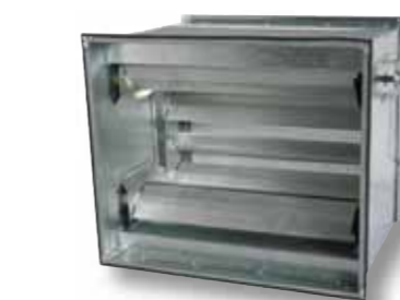
Směšovací komora s otočnými lamelami